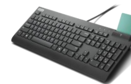
Teclado Lenovo USB Smartcard 4Y41B69380