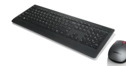
Combo Lenovo Teclado y Ratón Inalámbrico 4X30H56823