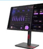
Monitor Lenovo ThinkVision T24i-30 63CFMATXEU