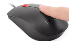
Ratón Lenovo con lector de huella biométrica 4Y51M03357